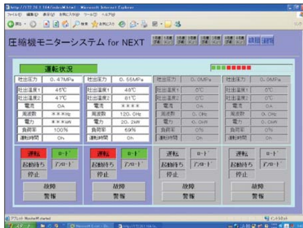
■ マルチモニター画面

RS485マルチドロップ方式を採用。既存LANと接続ができ、配線工事が容易で経済的です。別途データベース管理ソフト（近日発売）をパソコンにインストールすることによりトレンド作成などの監視機能の強化が図れます。