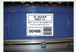
ミューチップ貼付バケット

バケット読み取りによるリアルタイムな入庫・ピッキング・出庫作業指示が可能 部品ピッキングに合わせた出荷指示伝票(兼現品票、納品伝票)の印刷が可能 RFID付きバーコードラベル発行も可能(オプション)